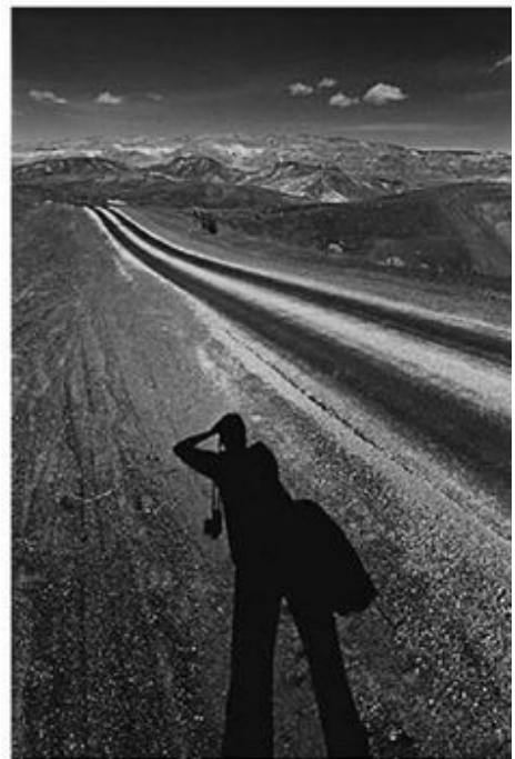
Autoportrait, Vallée de la Mort, Californie, 1977.